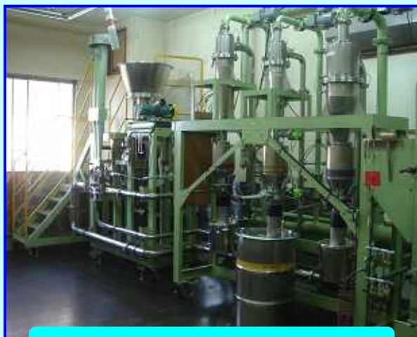
乾式気流式分級機EJ-15-3S型